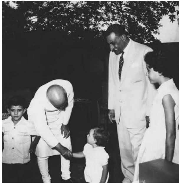
مع نهرى فى منشية البكرى ١٩٥٧/٧/٧